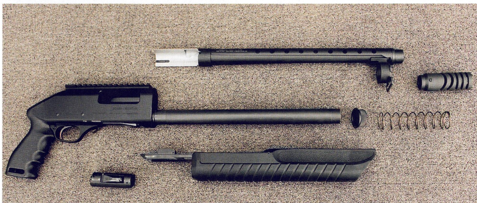
Rozložený model Martial, shora dolů: hlaveň s prodlouženou zadní částí, ústvá brzda, tělo zbraně s pistolovou rukojetí a zásobníkovou trubicí, matice zásobníkové trubice, pružina, předpažbí s táhlem, závěr

„Pokud jde o hlaveň brokovnice, tak ta je opatřena pláštěm či krytem perforovaným kulatými otvory. Což je jednak designová záležitost, ale zadruhé a především, kryt chrání střelco-