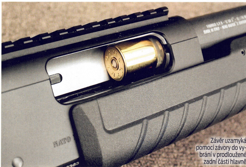
Závěr uzamýká pomocí závory do výbrání v prodloužené zadní části hlavně

Jde o hodně používaný a bezpečný systém uzamykání opakovacích brokovnic Fabarm vůbec. Jako všechny zbraně provenience Fabarm je i Martial Ultra Short kompletně vyráběná v Itálii, ať již jde o plasty či kov. Hlavně jsou na rozdíl od hlavní jiných značek