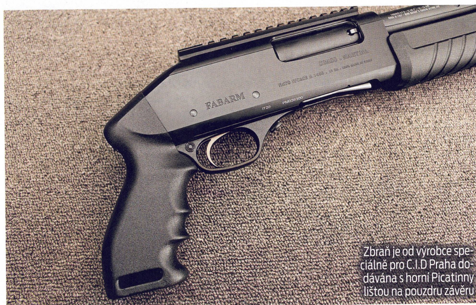
Zbraň je od výrobce speciálně pro C.I.D Praha dodávána s horní Picatinny lištou na pouzdrů závěru