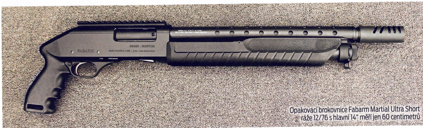
Opakovací brokovnice Fabarm Martial Ultra Short ráže 12/76 s hlavní 14" měří jen 60 centimetrů

Opakovací brokovnice italské zbrojovky Fabarm Martial Ultra Short ráže 12/76 s hlavní dlouhou necelých 360 milimetrů patří do kategorie „class of martial shotgun“, do třídy bojových brokovnic typu Home Defense (HD) či Law Enforcement.