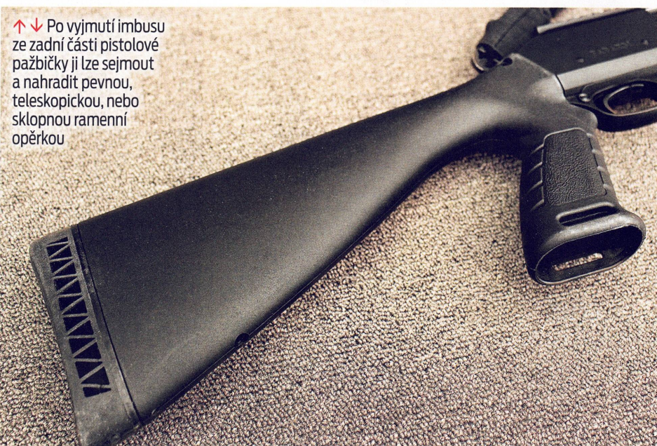
↑ ↓ Po vyjmutí imbusu ze zadní části pistolové pažbičky ji lze sejmut a nahradit pevnou, teleskopickou, nebo sklopnou ramenní opěrkou